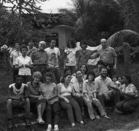
Passeio com a comunidade de Belo Horizonte, em junho de 1985. Na página ao lado, primeira comunhão na paróquia da cidade de Moeda, 1987.