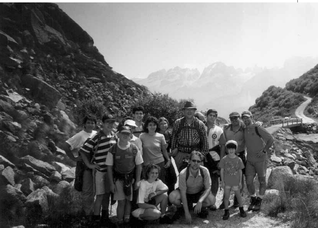
Férias na Itália, em 1994.